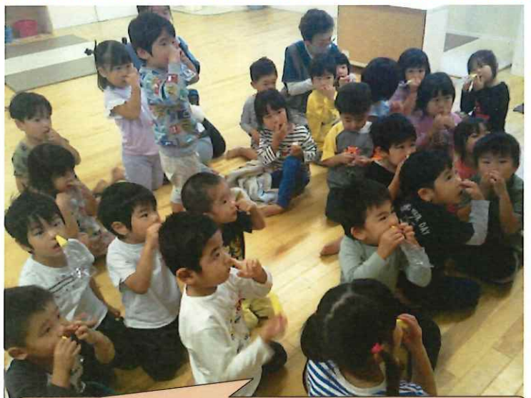
風船、膨らむかな～？ 上手いかず、指や口で…!?の子も(笑)でも、みんな一生懸命！ 真似っこしてくれました。